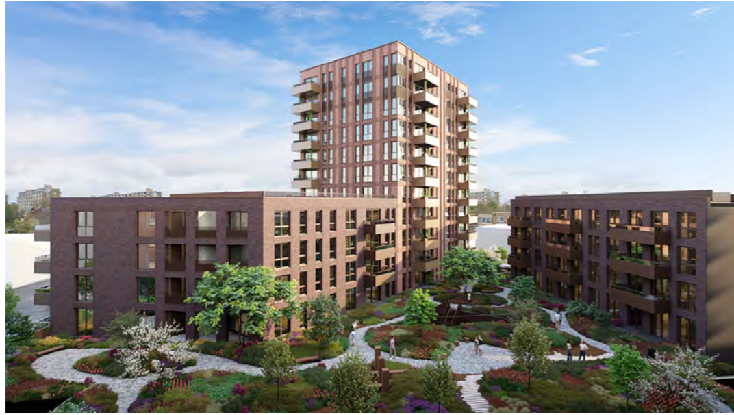
In de ochtend om 08:00 uur