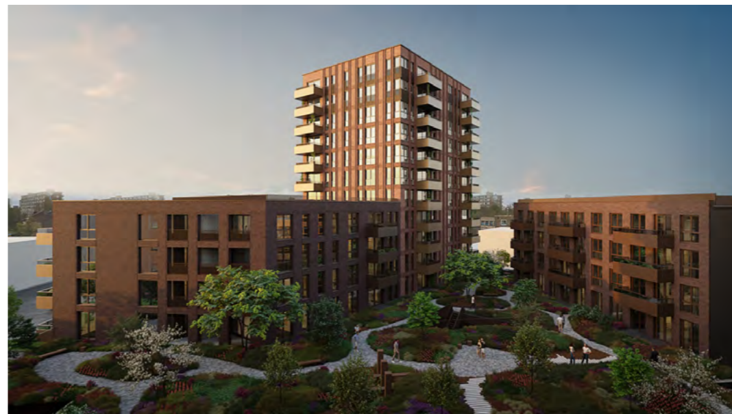
In de avond om 20:00 uur