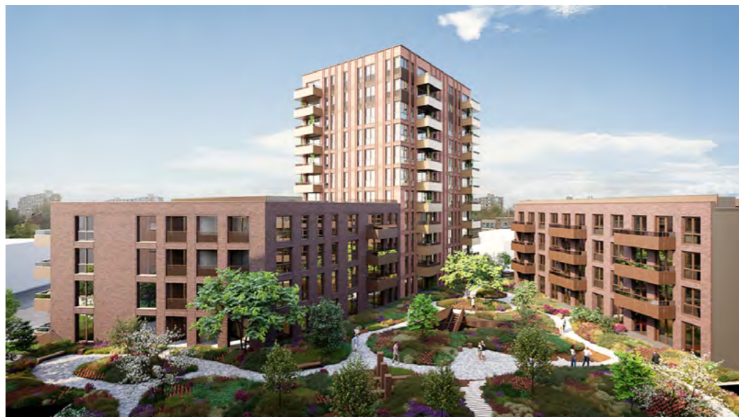
In de middag om 16:00 uur