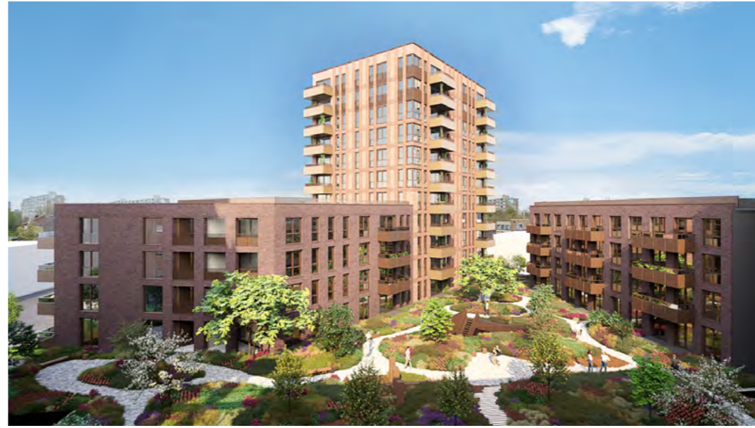
In de middag om 14:00 uur