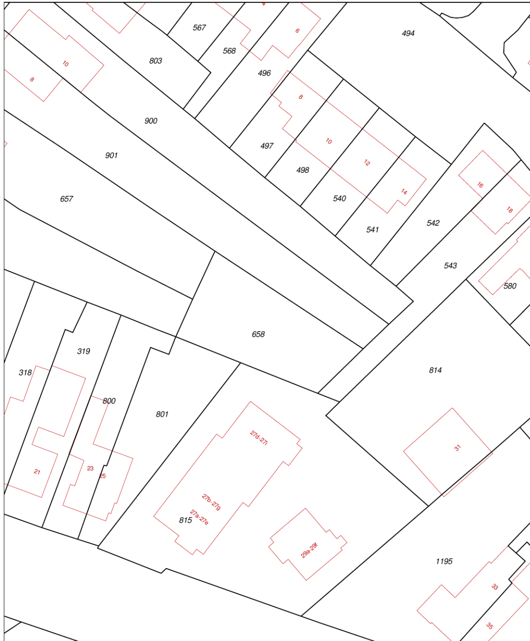
Uittreksel Kadastrale Kaart